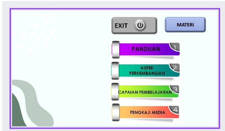
Gambar 2. Screenshot tampilan awal media kosa kata Bahasa ibu Nagekeo berbasis web

(2)Penyusunan buku panduan penggunaan media kosa kata Bahasa ibu Nagekeo berbasis web