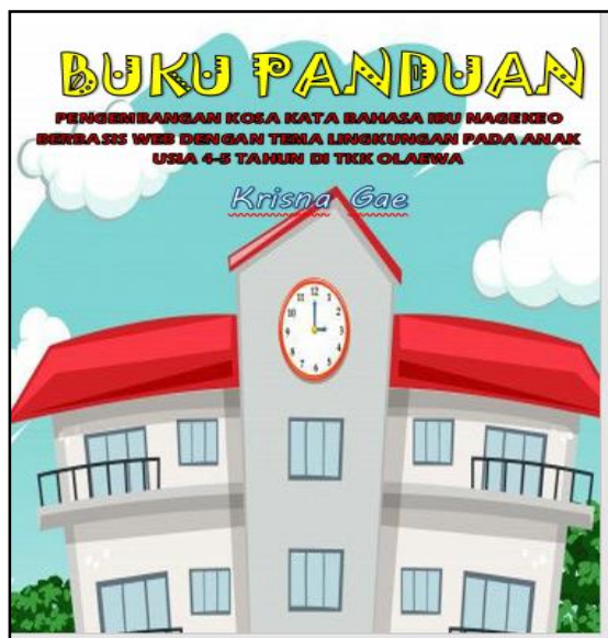
Gambar 3. Cover depan panduan penggunaan media kosa kata bahasa ibu Nagekeo berbasis web

Selain pembuatan produk media kosa kata Bahasa ibu Nagekeo berbasis web, peneliti juga membuat buku panduan penggunaan media kosa kata Bahasa ibu Nagekeo berbasis web. Tampilan panduan penggunaan media kosa kata Bahasa ibu nagekeo berbasis web dan langkah-langkah penggunaannya dapat dilihat pada gambar berikut ini.