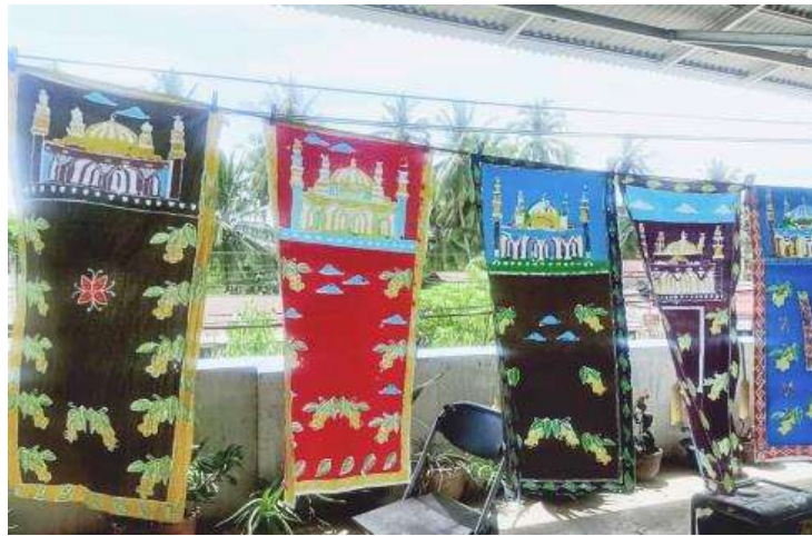
Gambar 6. Proses menjemur kain batik