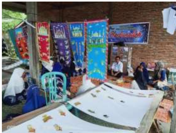
Gambar 5. Kain yang dibentangkan untuk diwarnai

Tahapan selanjutnya setelah proses mencanting adalah pewarnaan. Proses pewarnaan dalam pelatihan ini menggunakan pewarna kimia remasol dengan teknik colet atau kuas. Pada proses pewarnaan kain dibentangkan pada alat yang disebut pemedangan agar memudahkan peserta dalam mewarnai kain nantinya.