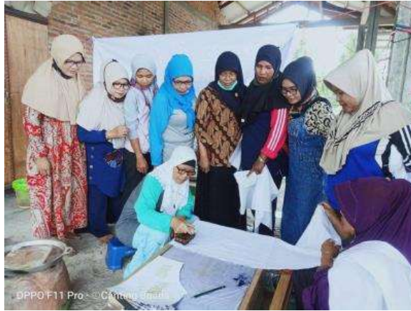
Gambar 4. Proses mencanting kain