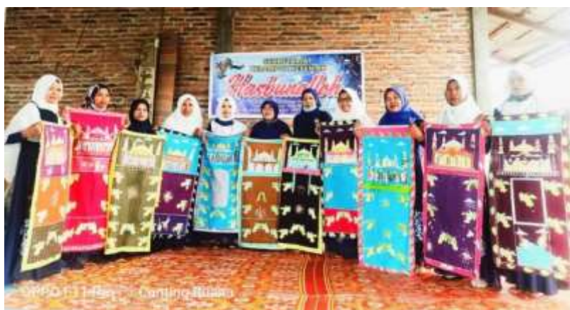
Gambar 8. Hasil karya batik berbentuk sajadah batik peserta pelatihan