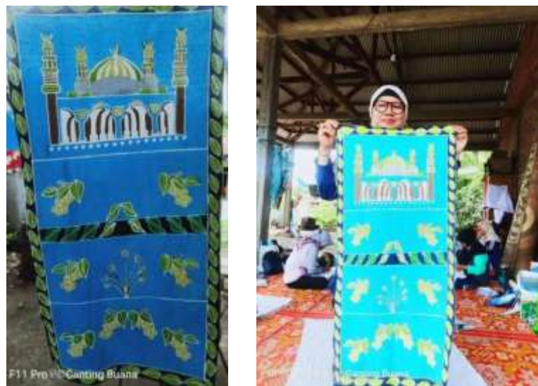
Gambar 7. Hasil produk sajadah batik