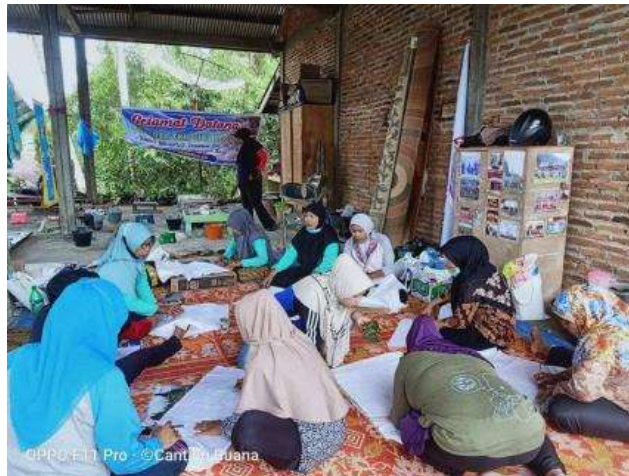
Gambar 3. Proses mendesain motif batik

Penciptaan sebuah karya seni termasuk batik pada dasarnya melalui tahapan dan proses tertentu seperti proses nalar berfikir, penghayatan batin dan proses kreatif lainnya (Sartika et al., 2021). Salah satu tahap awal dalam pembuatan batik adalah perancangan atau mendesain motif yang umumnya membutuhkan proses berfikir dan penghayatan batin untuk menciptakan berbagai bentuk-bentuk motif yang disesuaikan dengan bentuk produk yang akan diwujudkan. Perancangan adalah tahap penerapan ide dan gagasan pemikiran terkait bentuk suatu karya (batik) yang dituangkan dalam bentuk desain (Purwaningsih et al., 2022). Proses mendesain motif dilakukan peserta dengan menggambar bentuk-bentuk motif yang diinginkan pada kain yang akan dibatik. Proses ini dilakukan dengan menyesuaikan karakter produk sajadah yang akan dibuat dengan tambahan motif khas daerah. Untuk memudahkan dalam proses mendesain sebelum desain dipindahkan ke atas kain para peserta membuat terlebih desain tersebut di atas kertas agar tidak terjadi kesalahan saat memindah suatu desain motif batik ke atas kain.