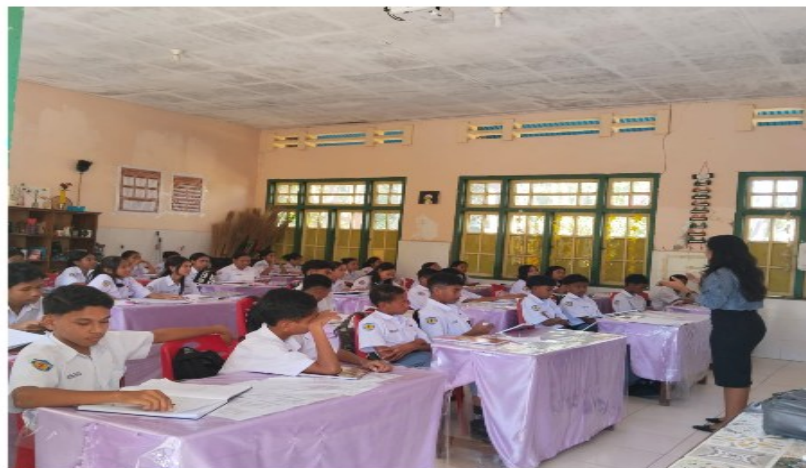
Gambar 3. Aspek Speaking Bahasa Inggris

Secara keseluruhan, hasil evaluasi yang ditampilkan melalui tabel dan grafik pretest–posttest menunjukkan bahwa penerapan metode Project-Based Learning dalam kegiatan PkM ini memberikan dampak positif dan terukur terhadap peningkatan kompetensi bahasa Inggris siswa di SMA St. Paulus Weliman. Data kuantitatif serta visualisasi grafik tersebut menjadi bukti empiris bahwa pembelajaran yang aktif, kolaboratif, dan kontekstual efektif diterapkan dalam konteks sekolah wilayah 3T.