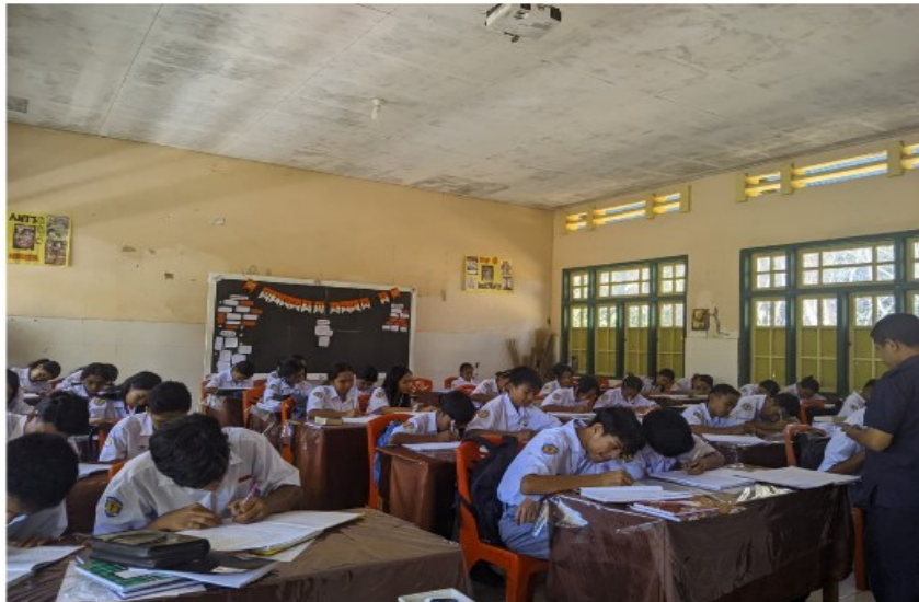
Gambar 2. Aspek Writing Bahasa Inggris