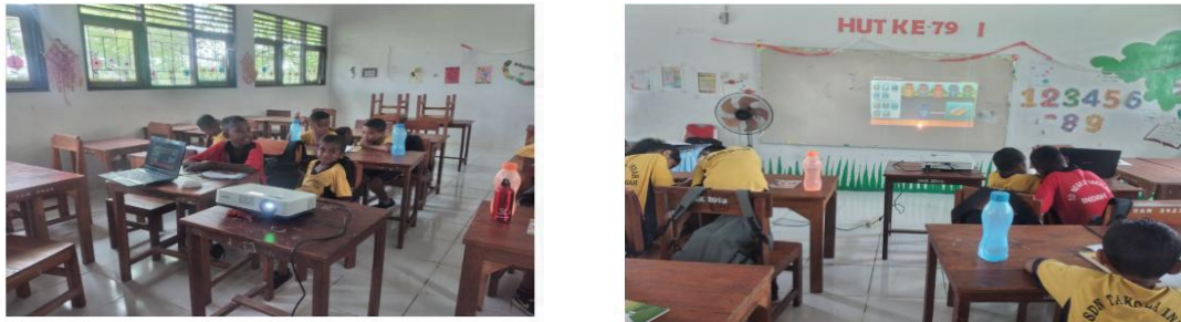
Gambar 4. Siswa Saat Melaksanakan Praktikum IPA dengan Pendampingan Fasilitator.