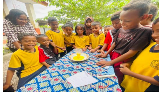
Gambar 3. Guru dan Siswa Mengikuti Sesi Demonstrasi Praktikum IPA Berbasis Virtual Laboratory