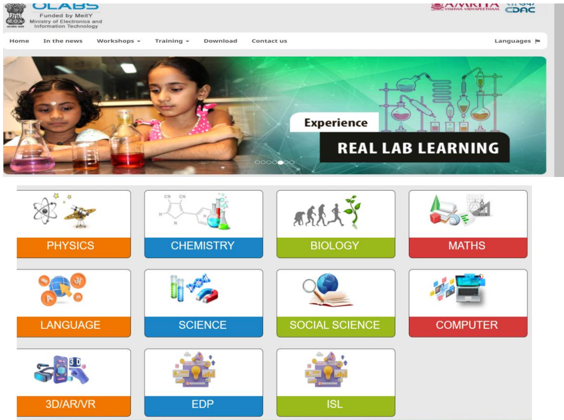
(a) Tampilan simulasi OLABS