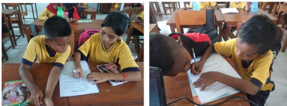
Gambar 5. Siswa Melakukan Pengisian Angket Minat

Tabel 3 menunjukkan bahwa minat siswa terhadap penggunaan laboratorium virtual meningkat secara signifikan. Sebelum kegiatan praktikum, rata-rata minat siswa sebesar 15,05 (kategori kurang berminat), sedangkan setelah kegiatan meningkat menjadi 75,99 (kategori sangat berminat). Dengan demikian, laboratorium virtual yang digunakan dalam pembelajaran IPA siswa kelas IV dan V UPTD SDN Takolah Indah termasuk kategori sangat menarik, sehingga layak digunakan dalam kegiatan pembelajaran.