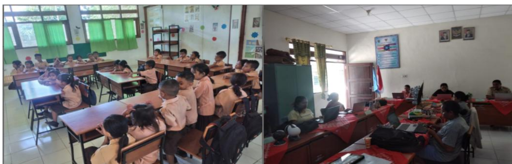
Gambar 2. Siswa sedang Mengikuti Sesi Observasi Laboratorium Virtual di Kelas.

Selain itu, observasi juga menyoroti potensi laboratorium virtual dalam mengatasi keterbatasan fasilitas laboratorium fisik di sekolah, terutama untuk eksperimen yang membutuhkan peralatan khusus atau memiliki risiko tinggi.