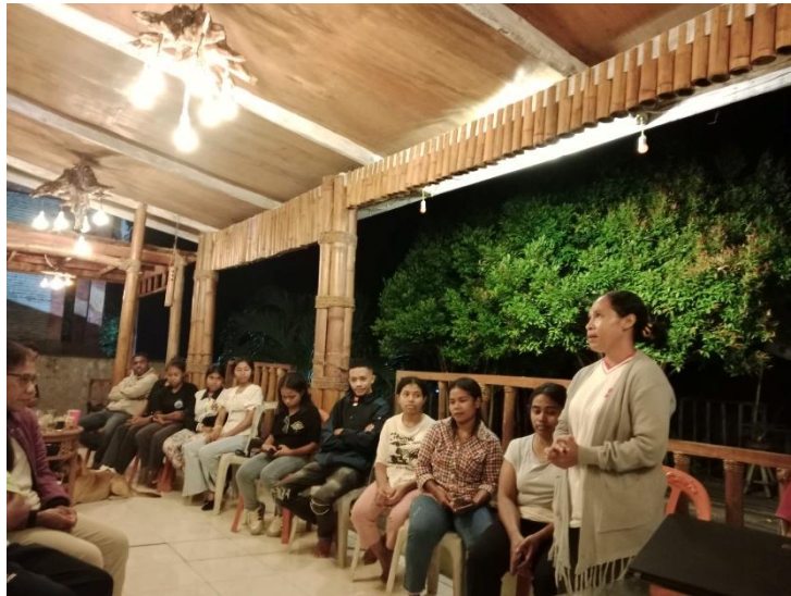
Gambar 2. Sesi Sharing

Sesi sharing kemudian memberi ruang bagi peserta untuk berbagi pengalaman iman secara pribadi. Antusiasme peserta sangat tinggi, terlihat dari keberanian mereka mengungkapkan pengalaman hidup yang inspiratif dan memotivasi. Sharing ini mempererat rasa solidaritas, membangun empati, dan meneguhkan identitas iman komunitas OMK. Hal ini sejalan dengan semangat Christus Vivit yang menekankan pentingnya pendampingan kaum muda dalam menemukan identitas Kristiani mereka.