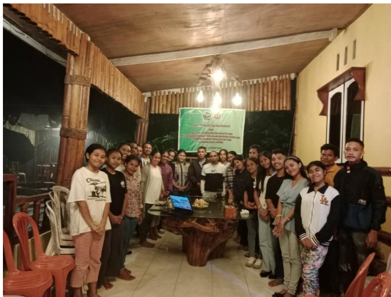
Gambar 4. Foto Bersama Tim Abdimas dan Mitra