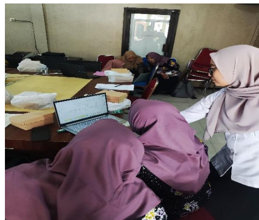
Gambar 4. Praktik Penyusunan Laporan