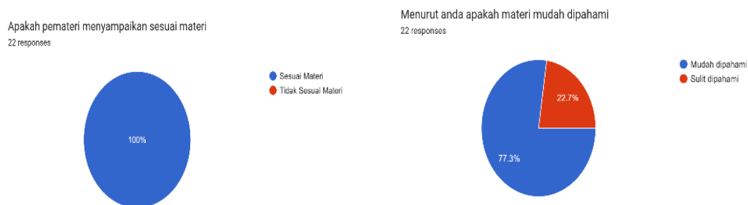
Gambar 5. Hasil Survei Kegiatan Pendampingan

Tahap evaluasi dilakukan setelah kegiatan pendampingan selesai dengan meminta peserta mengisi daftar hadir dan kuesioner umpan balik. Evaluasi ini bertujuan mengukur pemahaman peserta, efektivitas metode yang digunakan, serta dampak kegiatan terhadap peningkatan kemampuan penyusunan laporan keuangan.