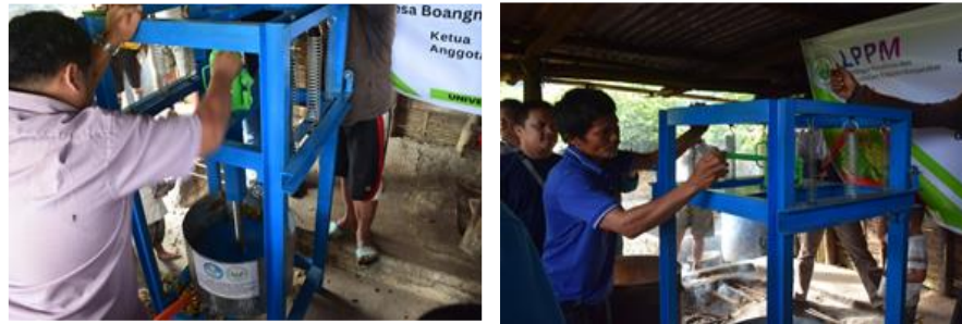
Gambar 6. Mengepress/Memeras Rebusan Daun Gambir

Pada langkah-langkah tersebut terlihat perbedaan metode pengepresan getah daun gambir dengan menggunakan metode konvensional dan mesin. Pada alat konvensional tersebut, daun gambir dipindahkan ke dalam goni, lalu diikat, dan diletakkan di bawah alat pengepresan untuk diperas getahnya. Hasil perasan gambir yang diperoleh dapat dilihat pada gambar berikut ini: