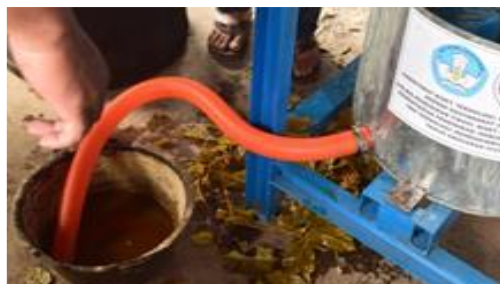
Gambar 7. Hasil Perasan Daun Gambir

Pada langkah-langkah tersebut terlihat perbedaan metode pengepresan getah daun gambir dengan menggunakan metode konvensional dan mesin. Pada alat konvensional tersebut, daun gambir dipindahkan ke dalam goni, lalu diikat, dan diletakkan di bawah alat pengepresan untuk diperas getahnya. Hasil perasan gambir yang diperoleh dapat dilihat pada gambar berikut ini: