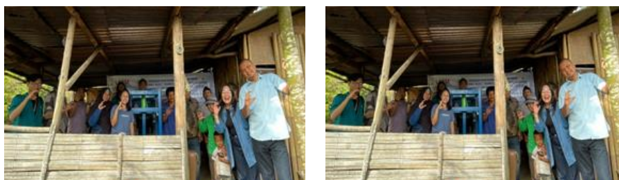
Gambar 8. Foto Bersama di Akhir Kegiatan

Hasil perasan daun gambir tersebut diendapkan terlebih dahulu selama 1 malam sehingga diperoleh getah padat. Lalu getah padat tersebut dibentuk menjadi bulat, kemudian dikeringkan pada terpal di bawah sinar matahari selama 24 jam. Rangkaian acara pada kegiatan pengabdian di atas berakhir setelah seluruh materi pelatihan dan target solusi yang ditawarkan dalam 2 hari. Di akhir acara, tim abdimas dan mitra melakukan foto bersama.