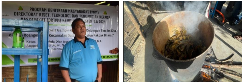
Gambar 5. Melatih dan Mendampingi Mitra Membuat Gambir yang Berkualitas dan Terstandar

Pada kegiatan pengabdian ini, mitra telah dilatih dalam membuat gambir yang berkualitas dan terstandar yaitu metode perebusan yang benar. Jumlah air perebusan yang benar adalah 1 : 10 (berat/volume), lama waktu perebusan adalah 45 menit. Setelah menjelaskan konsepnya, maka mitra dan tim pengabdian secara bersama-sama merebus daun gambir. Selain metode perebusan, tim pengabdian juga menyampaikan bahwa lama pengendapan getah gambir adalah 24 jam, dan proses pengeringan yang optimum di bawah sinar matahari yang cerah adalah selama 24 jam.