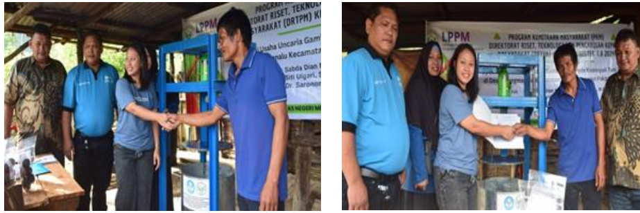
Gambar 4. Serah Terima Mesin