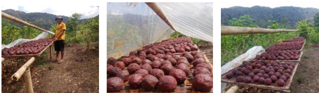
Gambar 3. Hasil Gambir Mitra

Dalam proses produksi, mitra juga tidak terampil menghasilkan gambir yang terstandar.