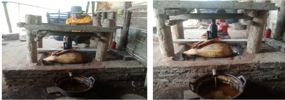
Gambar 2. Proses Pengepresan Menggunakan Alat Sederhana

Alat pengepres tersebut terbuat dari meja kayu yang merupakan hasil rakitan mitra. Dibawahnya ada alat dongkrak sederhana untuk memeras daun. Keadaan ini mengakibatkan volume getah gambir yang diperoleh hanya sedikit padahal daun yang direbus banyak. Sering juga terjadi daun gambir yang sudah dipress masih mengandung banyak air, sehingga mitra harus memeras daun kembali menggunakan lesung. Pekerjaannya menjadi dua kali dan tidak efektif. Setahun belakangan, jumlah produksi gambir sangat rendah dan jauh dari target.