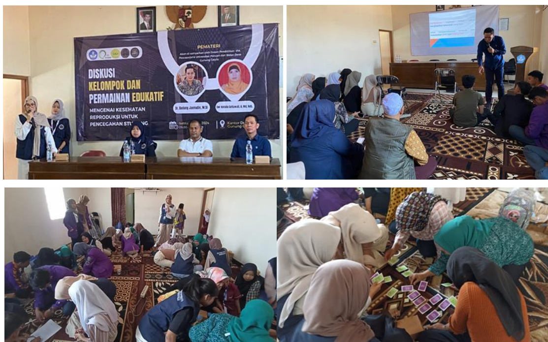
Gambar 4. Proses Pemaparan materi, Diskusi dan Permainan Edukatif

Salah satu faktor kunci keberhasilan program ini adalah penggunaan metode interaktif dan kolaboratif dalam pelatihan. Remaja tidak hanya menjadi penerima informasi, tetapi juga terlibat aktif dalam diskusi kelompok, simulasi kasus, dan permainan edukatif yang dirancang untuk memperkuat pemahaman mereka. Diskusi kelompok khususnya sangat efektif, karena memungkinkan peserta untuk berbagi pengalaman dan pandangan mereka, sehingga meningkatkan rasa kebersamaan dan dukungan sosial. Fasilitator yang terlatih juga memainkan peran penting dalam menciptakan suasana belajar yang menyenangkan dan inklusif. Gambar 2 merupakan proses diskusi dan permainan edukatif yang dilakukan dalam kegiatan ini.