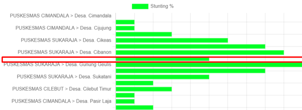
Gambar 1. Grafik Data Stunting di Kecamatan Sukaraja

Pada pernikahan dini, remaja seringkali belum mencapai kematangan fisik dan mental yang diperlukan untuk kehamilan dan melahirkan. Kehamilan pada usia muda meningkatkan risiko komplikasi kehamilan, kelahiran prematur, serta bayi dengan berat badan lahir rendah, faktor-faktor yang berkontribusi pada stunting pada anak-anak. Kurangnya akses terhadap layanan kesehatan reproduksi yang berkualitas dan pendidikan tentang gizi yang tepat dapat meningkatkan risiko stunting pada anak-anak mereka. Pada Gambar 1 dapat kita lihat data stunting di desa gunung geulis termasuk yang tinggi dibandingkan desa lainnya yaitu sebesar 10% anak mengalami stunting.