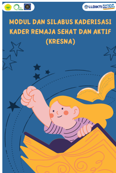
Gambar 2. Modul dan Silabus KRESNA

stunting. Materi pelatihan dirancang agar relevan dengan kebutuhan remaja di Desa Gunung Geulis dan disusun secara menarik agar mudah dipahami. Kumpulan materi kemudian dibuat panduan dalam bentuk modul dan silabus untuk KRESNA pada gambar 2.