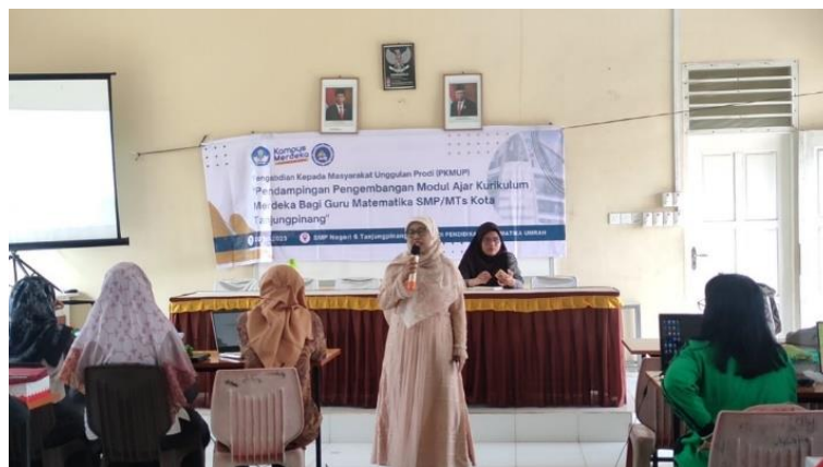
Gambar 1. Pemaparan Materi oleh Tim PKM

Kegiatan Pengabdian Kepada Masyarakat dilaksanakan mulai tanggal 20 Juli 2023 sampai dengan 24 Agustus 2023. Kegiatan dilaksanakan secara daring dan luring yang dibagi menjadi 3 tahap. Tahap 1 yaitu pelatihan pengembangan modul ajar yang diadakan secara luring di SMP Negeri 6 Kota Tanjungpinang. Pelatihan ini diikuti oleh 41 orang guru matematika tingkat SMP/MTs Kota Tanjungpinang. Pelatihan ini berupa penyampaian materi oleh Tim PKM. Materi yang disampaikan mencakup kurikulum merdeka, implementasi kurikulum merdeka dalam pembelajaran, merancang modul ajar serta asesmen penilaian.