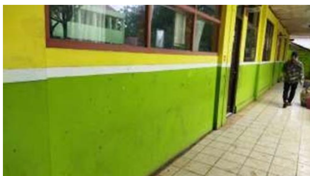
Gambar 1. Dinding yang akan dimural di SDN 077 Sejahtera Jl Sejahtera Bandung

Sayangnya, pemanfaatan mural sebagai media edukasi di sekolah-sekolah masih kurang optimal. Padahal, mural dapat berfungsi sebagai sarana pembelajaran yang menarik dan interaktif bagi siswa. Sekolah Dasar Negeri 077 Sejahtera, yang berlokasi di Jl. Sejahtera No.12 Bandung, merupakan salah satu sekolah yang belum memanfaatkan dinding-dindingnya untuk keperluan edukasi melalui mural. Sekolah ini didirikan pada tahun 1954 dan memiliki fasilitas yang memadai, termasuk halaman yang luas, lapangan upacara, dan area bermain yang dapat digunakan untuk berbagai aktivitas anak-anak.