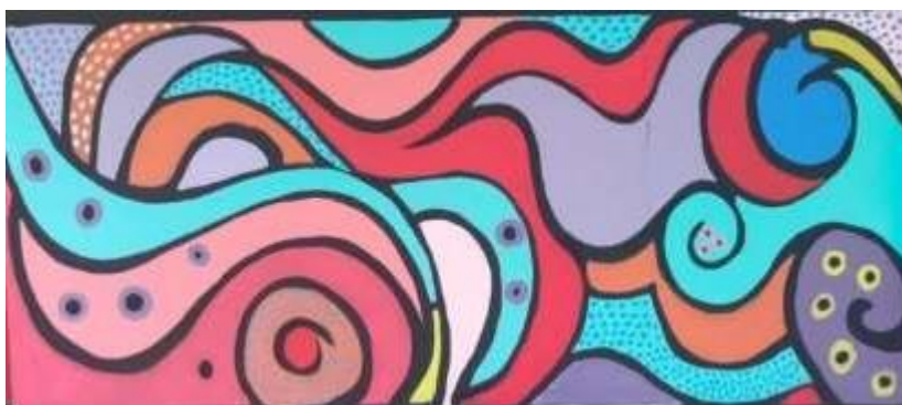
Gambar 8. Mural

Penyebaran warna seperti warna ungu, biru tosca muda, pink, oranye pada bagian bawah secara berdampingan, dengan warna-warna satu sama lain terpisah oleh outline hitam yang tebal, sehingga bentuk tersebut terlihat kontras. Penggunaan warna kuning pada alas bawah yang tidak terdapat pada bagian atas, menadikan warna lebih cerah dan penempatan warna oranye pada bagian bawah yang berjauhan dan warna oranye di sebrang atas, membentuk arah segi tiga, membuat komposisi warna lebih seimbang, ditambah lagi dengan penempatan warna biru tosca bertekstur biru yang berhadapan dengan warna tosca yang sama dapat mengimbangi keseluruhan komposisi yang solid. Warna kontras dari biru dan oranye, ungu dan kuning maupun hiau dan merah, pada komposisi ini semua terlihat satu kesatuan yang harmonis dan seimbang.