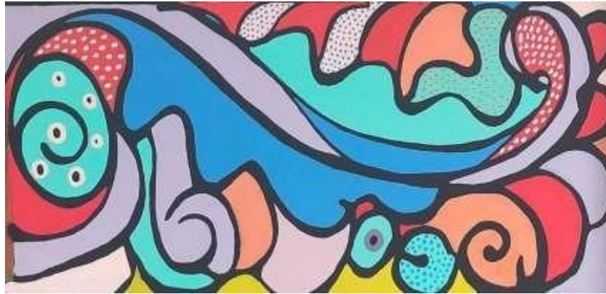
Gambar 7. Mural

Mural dekoratif pada dinding SDN Sejahtera ini, mempunyai komposisi yang solid, satu kesatuan, tetapi bila dilihat secara keseluruhan komposisi, terdapat warna yang didominasi oleh warna ungu dan warna biru, pada bagian sudut kiri atas yaitu warna ungu dibatasi oleh garis hitam tebal yang berbatasan dengan warna biru pada bagian bawahnya, kedua warna ini berdampingan membuat lengkungan dari sudut kiri atas sampai ke lengkungan bawah pertengahan warna ungu tersebut pada bagian atas garis menjadi warna biru, sehingga garis ini diapit oleh warna biru yang sama dengan warna di bawahnya. Selanjutnya dari ujung warna biru tersebut muncul warna ungu, seolah-olah merupakan sambungan dari warna ungu yang telah terputus oleh warna biru tadi, tetapi warna ungu ini mempunyai ukuran yang lebih tipis dari ukuran sebelumnya, ketebalan warna sisanya di bagian dalam, diisi oleh warna merah bertekstur titik-titik putih membentuk lengkungan spiral terpotong di sudut kanan atas, bersebelahan dengan warna ungu yang melingkupi spiral itu.