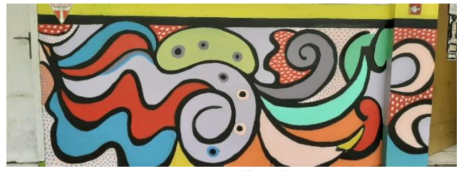
Gambar 3. Mural 2