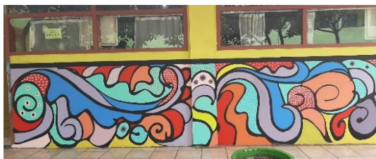
Gambar 4. Mural 3