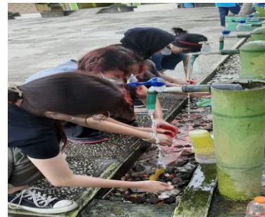
Penutupan Kegiatan, mencuci alat dan menutup seluruh ember cat