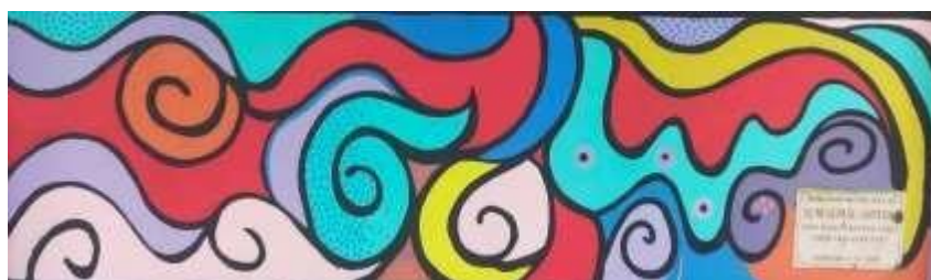
Gambar 9. Mural

Bagian lingkaran spiral ketiga berwarna biru tua dan warna kuning pada ujung luarnya, bersebelahan dengan biru tosca pada bagian bawah dan warna pink bertekstur biru pada sudut kanan atas. Komposisi ini sangat seimbang dengan adanya warna merah yang berada di tengah menghubungkan keduanya dan warna merah yang melingkari spiral ketiga serta warna ungu yang memecah dominasi warna merah di bagian tengah.