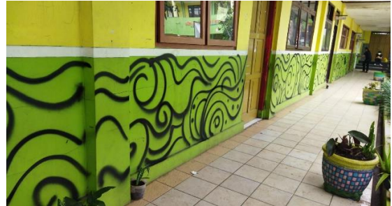
Proses Sketsa Mural