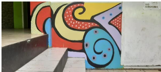
Gambar 2. Mural 1

Kegiatan pengabdian ini berjalan dengan sangat lancar, seluruh tim dapat bekerja sama dengan sangat baik. Pihak dari CSR juga berkesempatan melakukan monitoring kegiatan di lokasi. Adapun hasil dari mural yang sudah dikerjakan adalah sebagai berikut: