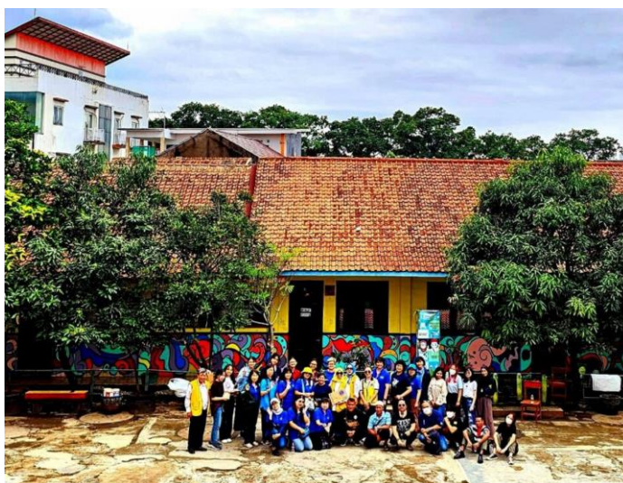
Gambar 10. Tim Abdimas

Mural sepanjang 30 m, dikerjakan selama kurang lebih dari awal hingga selesai selama 5 jam. Konseptor mural menerjemahkan tema Bandungku anu genah tumaninah, melalui garis-garis yang tidak kaku, tetapi dengan irama yang mengalir, merupakan. Secara visual objek dibuat besar mendominasi bidang untuk menegaskan bahwa bidang tersebut tumaninah dalam arti nyaman untuk digambari, pesan yang hendak disampaikan melalui objek ini adalah Kota Bandung adalah kota yang nyaman untuk ditinggali oleh penduduknya. Warna-warni dari awal sengaja dikonsepsi dengan menggunakan warna-warna yang ceria yang diwakili oleh warna primer. Hal ini mewakili jiwa anak-anak yang bersekolah setiap hari. Mural yang telah selesai ini diapresiasi dengan sangat baik oleh pihak sekolah. Sekolahpun terasa lebih tumaninah, resik dan nyaman dipandang. Setelah kegiatan selesai, ditutup dengan sesi foto bersama.