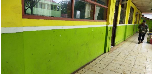
Dinding Sekolah Sebelum di Mural