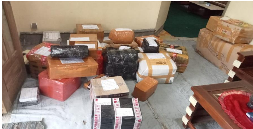
Gambar 4. Paket Konsumen dengan resi yang masih ditulis tangan oleh mitra

Kegiatan ketiga adalah pembuatan resi kepada konsumen secara tersistem yaitu memindahkan penulisan resi yang manual dengan menggunakan software microsoft word dan software paint , selanjutnya dicetak dan diberikan kepada konsumen serta ditempelkan ke barang yang akan di kirim. Karena beberapa konsumen menuliskan alamat dengan cara ditulis tangan dengan menggunakan bolpoint. Oleh sebab itu, karyawan harus mengganti tanda barang pengiriman manual dengan resi BJ-X yang sudah dibuat dengan software microsoft word dan software paint . Adapun Gambar 4 resi BJ-X Agen Purwoharjo yang berbentuk manual, sebagai berikut: