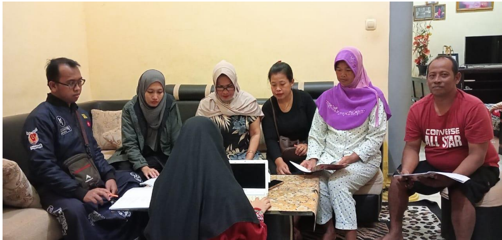
Gambar 3. Penjelasan materi

Kegiatan ketiga adalah pembuatan resi kepada konsumen secara tersistem yaitu memindahkan penulisan resi yang manual dengan menggunakan software microsoft word dan software paint , selanjutnya dicetak dan diberikan kepada konsumen serta ditempelkan ke barang yang akan di kirim. Karena beberapa konsumen menuliskan alamat dengan cara ditulis tangan dengan menggunakan bolpoint. Oleh sebab itu, karyawan harus mengganti tanda barang pengiriman manual dengan resi BJ-X yang sudah dibuat dengan software microsoft word dan software paint . Adapun Gambar 4 resi BJ-X Agen Purwoharjo yang berbentuk manual, sebagai berikut: