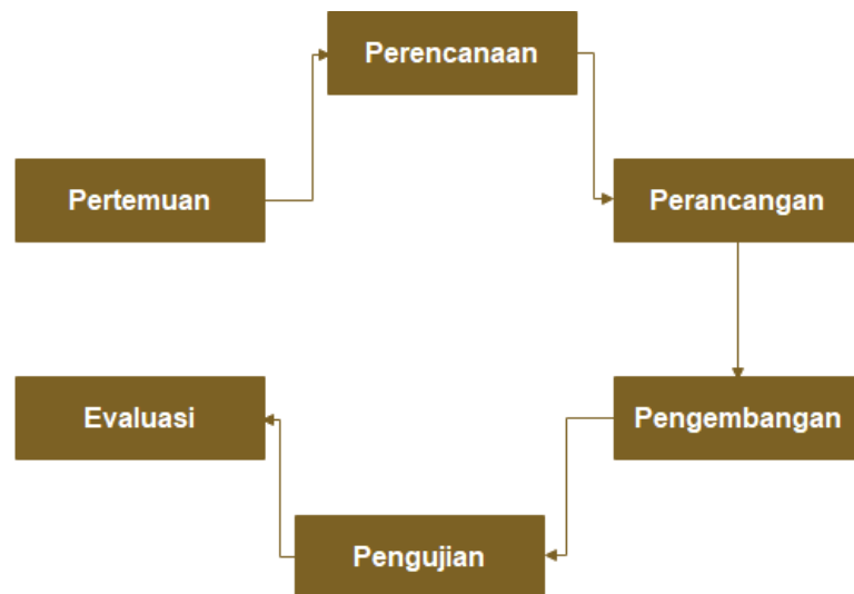
Gambar 2. Metode Pelaksanaan

2. Tahap perencanaan merupakan tahapan dalam berkomunikasi dengan tim pengabdian untuk menyusun pembagian tugas dan jadwal pelaksanaan yang terdiri atas kegiatan dialog dan diskusi, perencanaan, perancangan, pengembangan, pengujian dan evaluasi seperti ditunjukkan pada Tabel 1.