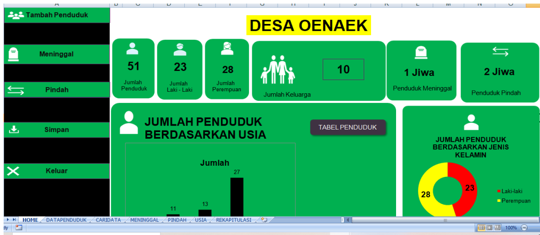
Gambar 3. Antarmuka Dashboard Aplikasi Pendataan Penduduk