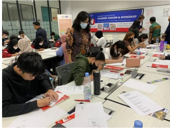
Gambar 5. Proses mentoring peserta

Dari hasil karya peserta workshop ini dapat dilihat bahwa tidak semua dari mereka langsung memahami bagaimana membuat narasi visual yang baik. Beberapa peserta lebih banyak menghabiskan waktu untuk membuat karakter sehingga karyanya tidak selesai. Ada juga yang tidak mengikuti brief yang diberikan sehingga yang seharusnya hanya diminta membuat 6 panel, peserta tersebut justru membuat 8 panel. Namun beberapa peserta terlihat sudah mampu menuangkan kreativitasnya sesuai brief yang diberikan. Mereka juga terlihat sangat antusias serta bersemangat dalam mengikuti kegiatan tersebut. Dari beberapa komponen pendukung narasi visual, secara umum dapat disimpulkan bahwa: