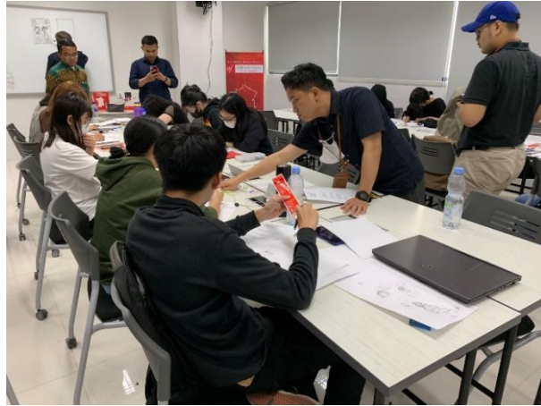
Gambar 2. Pelatihan pembuatan narasi visual