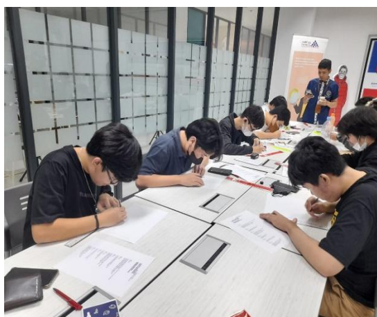
Gambar 4. Peserta sibuk menuangkan kreativitasnya dalam membuat komik

Para mentor memotivasi peserta yang karyanya belum selesai untuk tetap berlatih dan sering membaca komik atau mencari referensi sehingga memperkaya ide-ide mereka untuk membuat karya komik selanjutnya.