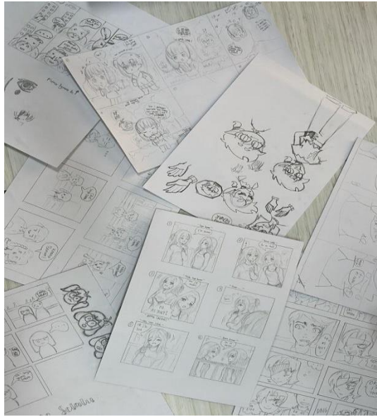
Gambar 6. Hasil karya peserta

beberapa peserta yang sudah mulai menggambarkan lokasi dan latar belakang ini walaupun belum sempurna.